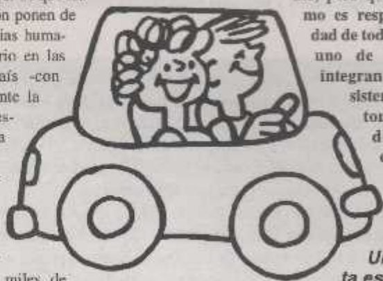
Una visita esperada

Pero, la pregunta es: ¿Tiene solución el tránsito argentino, y en particular, el de Buenos Aires? "Luchemos...", a través de sus propuestas y campañas publicitarias, pone de manifiesto que es posible el cambio, pero que el mismo es responsabilidad de todos y cada uno de los que integran dicho sistema: peatones, conductores, etc.